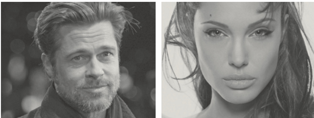
Abbildung 2: Genetische Qualität – Testosteron und Östrogenmarker

Weitere Sexualhormon-Marker bei Frauen sind: Ihre Sanduhr-Figur – diese verrät: „Ich bin ein begehrenswerter Liebespartner! Im besten Alter zur Vermehrung, kerngesund, mit ausreichenden Energiereserven für die Geburt und das Stillen des Babys, auch wenn das Jägerglück meinem Partner vorübergehend unhold werden sollte.“ Denn besagte Rundungen lassen sich auf physiologischem Wege in Muttermilch verwandeln, und so verhungert dessen Kind nicht, der diese Anzeichen der Weiblichkeit präferiert. Ein ausgeprägter weiblicher Sexualhormon-Level führt zur glatten, samtigen Haut mit einem guten Tonus, zu seidigem Haar, gesunden Zähnen und Nä-