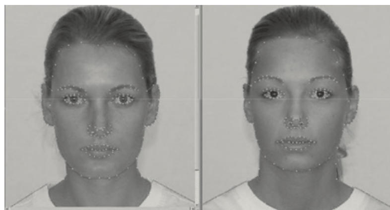
Abbildung 4: Das Beautycheck-Experiment

Bahnbrechend in der weltweiten empirischen Messung von der Schönheit von Gesichtern und Körperformen ist das Beautycheck-Experiment von Martin Gründl (2013). Er fotografiert gewöhnliche Frauen und Männer. Die eingescannten Bilder kann er mit Hilfe einer speziellen Software an markanten Punkten systematisch verändern (Abbildung 4). Die so entstandenen bearbeiteten Bilder lässt er von tausenden von Frauen und Männern online