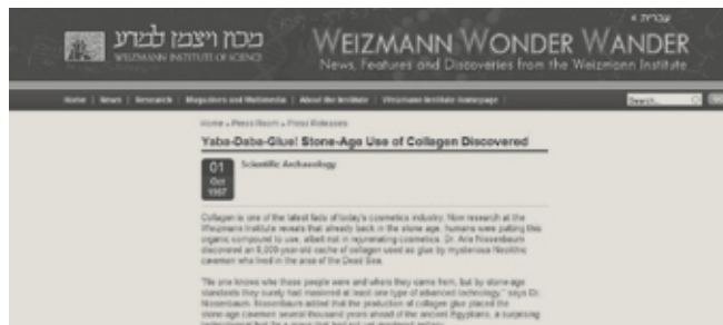
Abbildung 1: Steinzeit-Kosmetik in der internationalen Presse