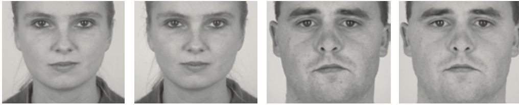
Abbildung 3: Symmetrie. Ein schiefes Gesicht ist „schiach“ (Bayerisch für hässlich). (Quelle: Little & Jones, 2003)

gel. Weshalb werben diese Merkmale für Gesundheit? Weil sie auf natürliche Weise nur zustande kommen können, wenn die Trägerin kerngesund ist, frei von Pathogenen und Parasiten. Wäre das nicht der Fall, könnte sie es sich nicht leisten, ihre eigene Immunkraft zu schwächen durch Aufrechterhaltung eines hohen Niveaus ihres Geschlechtshormons, das ein starker Immununterdrücker ist (Thornhill & Gangestad, 1999). Die Fruchtbarkeit erhöht die Attraktivität einer Frau nicht nur generell im Sinne von jungen Jahren, sondern durchaus auch in Bezug auf den aktuellen Zyklus, wie eine Studie von Miller, Tybur und Jordan (2007) beweist, dass Stripteasetänzerinnen mehr Trinkgeld an ihren fruchtbaren Tagen bekommen.